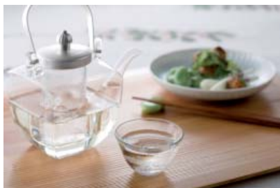
Sake japonés NENOHI" (Morita Co., Ltd.)