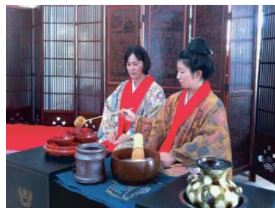
Ryukyu Ceremonia del té: Akeshinono-kai