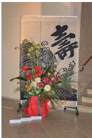
Ikebana - Arreglo floral: Art & Culture Association