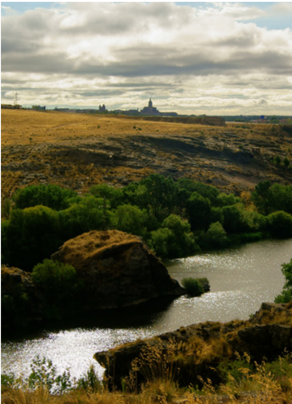
Paisaje salmantino. Fotografía, 2017-2018. Colección particular