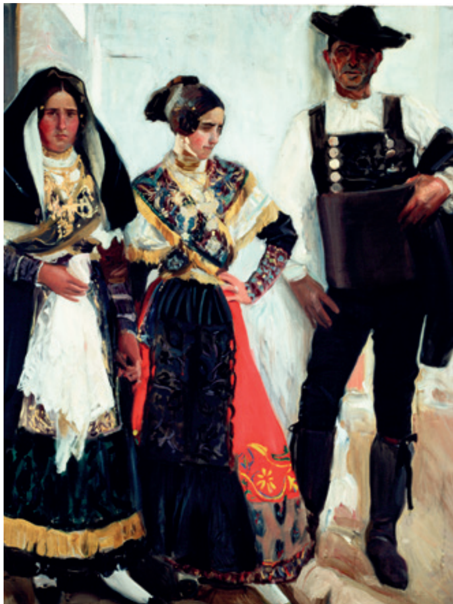
Joaquín Sorolla. Tipos de Salamanca . Óleo sobre lienzo, 1912.