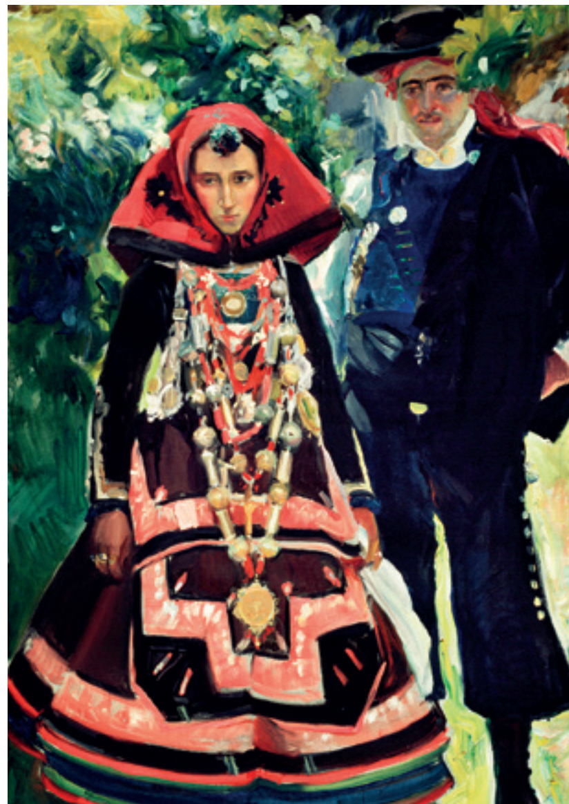
Joaquín Sorolla. Novios salmantinos . Óleo sobre lienzo, 1912.