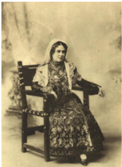
Venancio Gombao (fotógrafo). Retratos de charros de Salamanca . Fotografías, s.a. [finales siglo XIX]. © Biblioteca Nacional de España (Madrid)